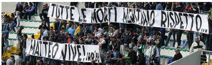
GLI IRRIDUCIBILI CHIETI RIBADISCONO CHE LA MORTE E' UGUALE PER TUTTI