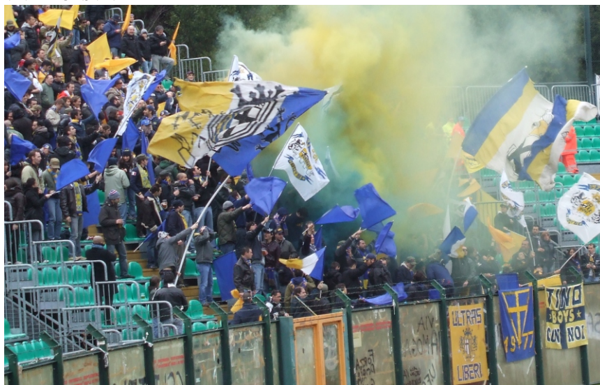
SIENA-PARMA 06/07 FUMOGENI E BANDIERONI SUPERANO IL DECRETO ANTI TIFO