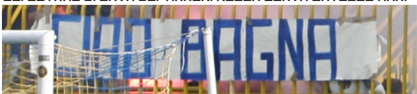
LO STRISCIONE DEGLI ULTRAS DI CASTELLAMARE DI STABIA