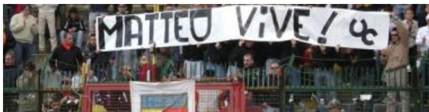
GLI ULTRAS CATANZARO AL CERAVOLO