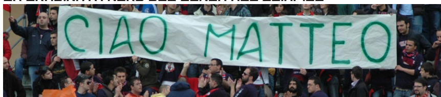
LA CURVA NORD DI COSENZA SALUTA IL BAGNA