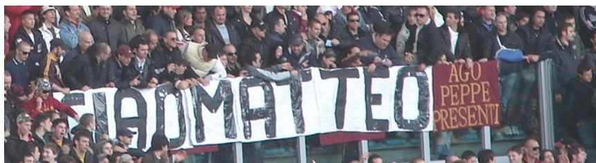
IL SALUTO DEI FEDAYN DELLA SUD DI ROMA