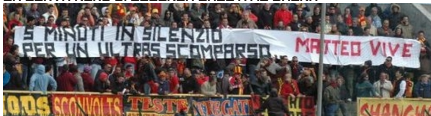
I 5 MINUTI DI SILENZIO DELLA CURVA DI BENEVENTO