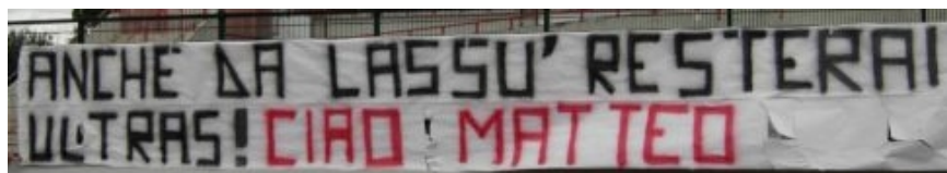
LE WSB CESENA SOTTO "LA MARE" MA SENZA AUTORIZZAZIONE