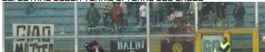
GLI ULTRAS DI LIVORNO A MARASSI CONTRO LA SAMP