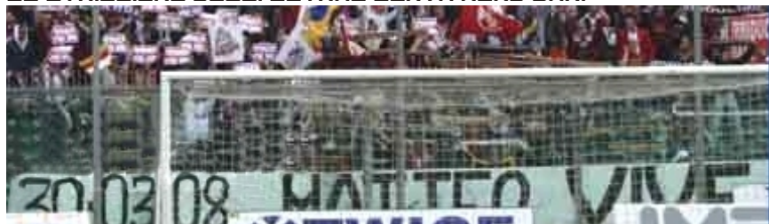
LA CURVA SUD DI SALERNO AD ANCONA