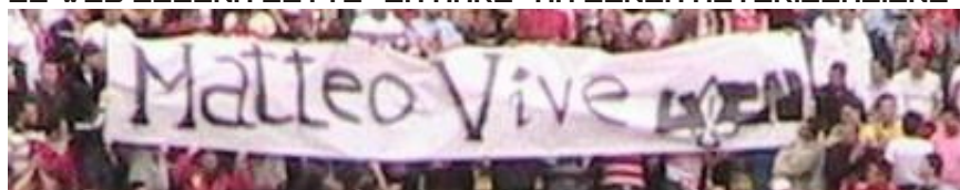
LO STRISCIONE DEGLI ULTRAS CURVA NORD BARI