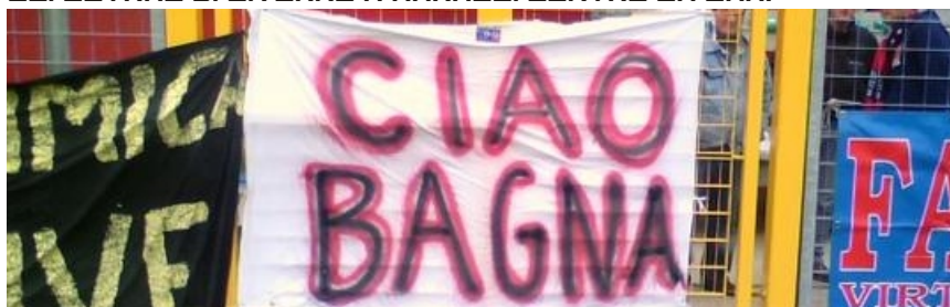
I VIRTUS FANS TERZA SQUADRA DI VERONA