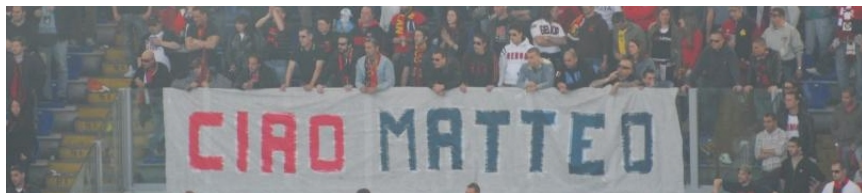
LA GRADINATA NORD DEL GENOA ALL'OLIMPICO