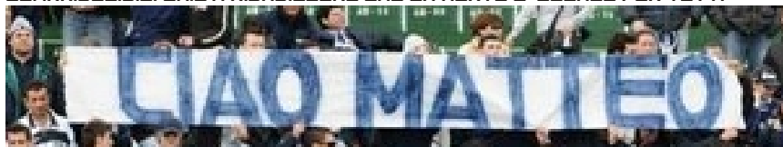
GLI ULTRAS DI CAVA DEI TIRRENI NELLA CURVA CATELLO MARI