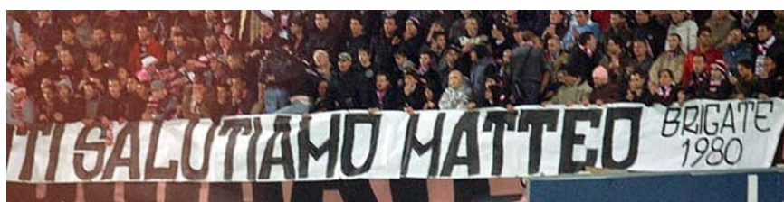
LE BRIGATE DI PALERMO E GLI ULTRAS CURVA SUD CONTRO LA JUVE